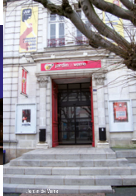
Jardin de Verre

+ D'INFOS cholet.fr (programme complet) Retrouvez-nous sur le Facebook @theatresaintlouischolet