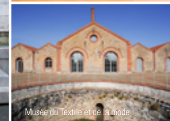
Musée du Textile et de la mode