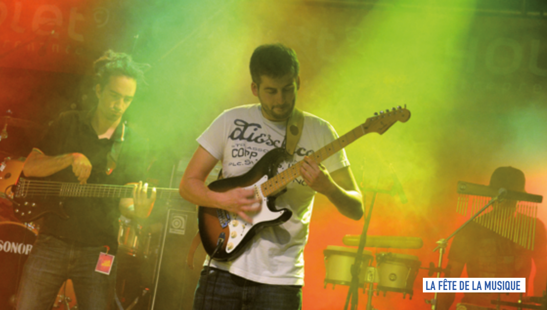
LA FÊTE DE LA MUSIQUE