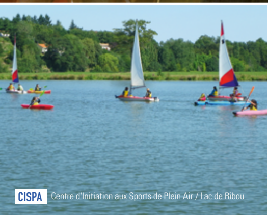
CISPA Centre d'Initiation aux Sports de Plein Air / Lac de Ribou