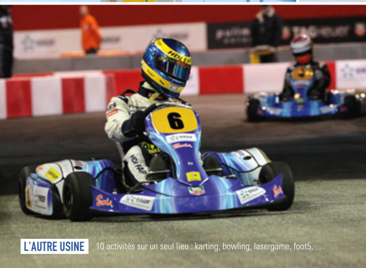
L'AUTRE USINE 10 activités sur un seul lieu : karting, bowling, lasergame, foot5, ...