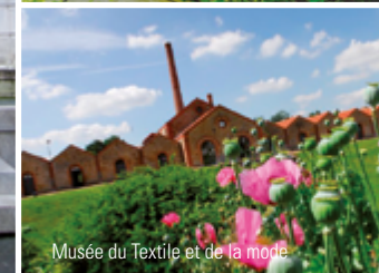
Musée du Textile et de la mode