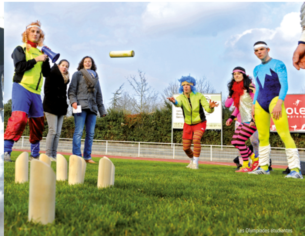
Les Olympiades étudiantes