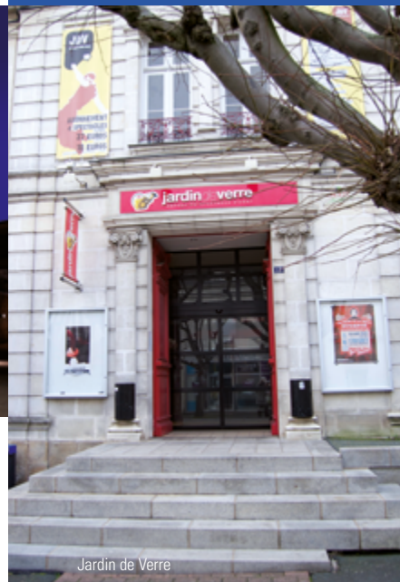
Jardin de Verre