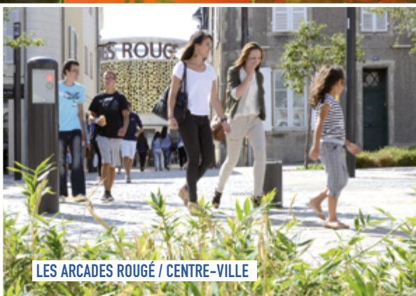
LES ARCADES ROUGÉ / CENTRE-VILLE