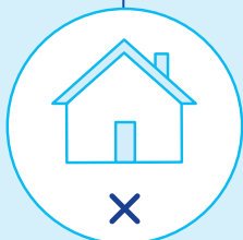
Schéma vaccinal incomplet** et non-vacciné