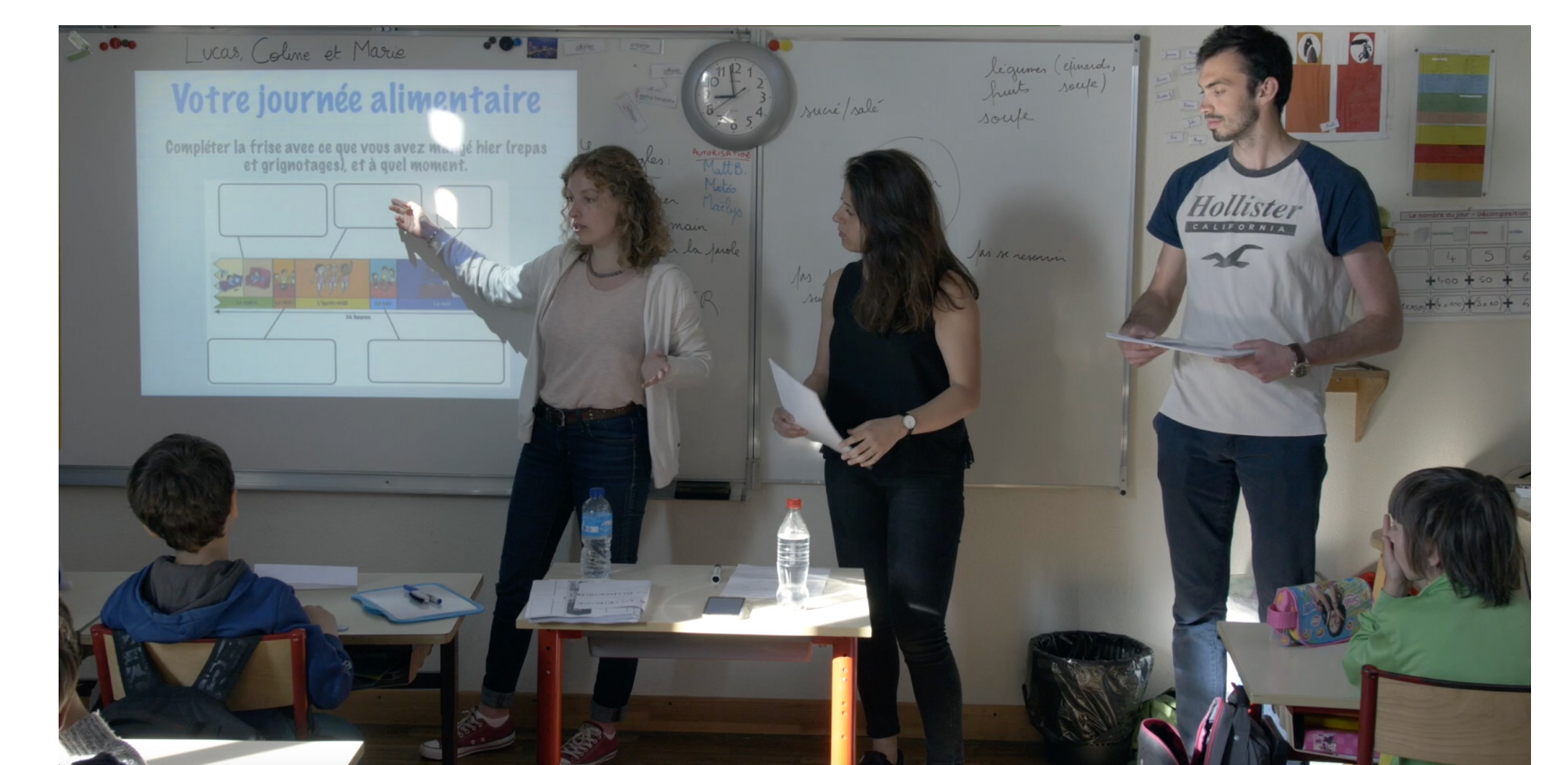
Clip de présentation du dispositif: https://medecine.univ-rennes.fr/service-sanitaire