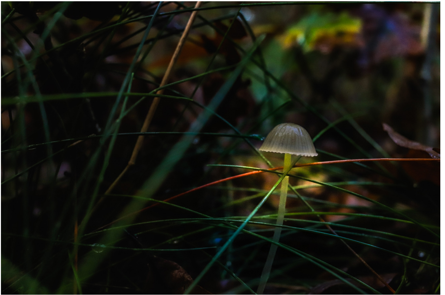
ALLARD Arthur - UCO