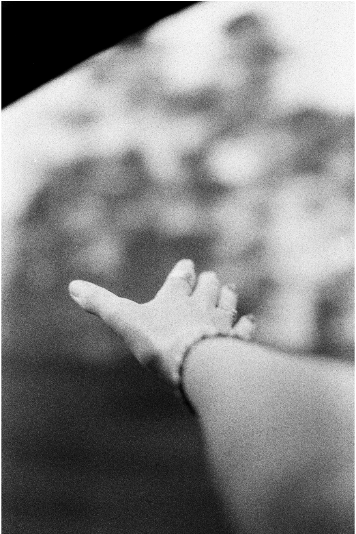
YVON Coline - UCO