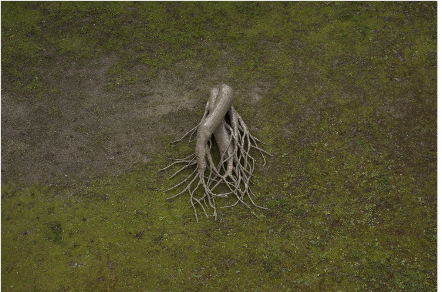
BROCHARD Jeanne - UCO (dyptique)