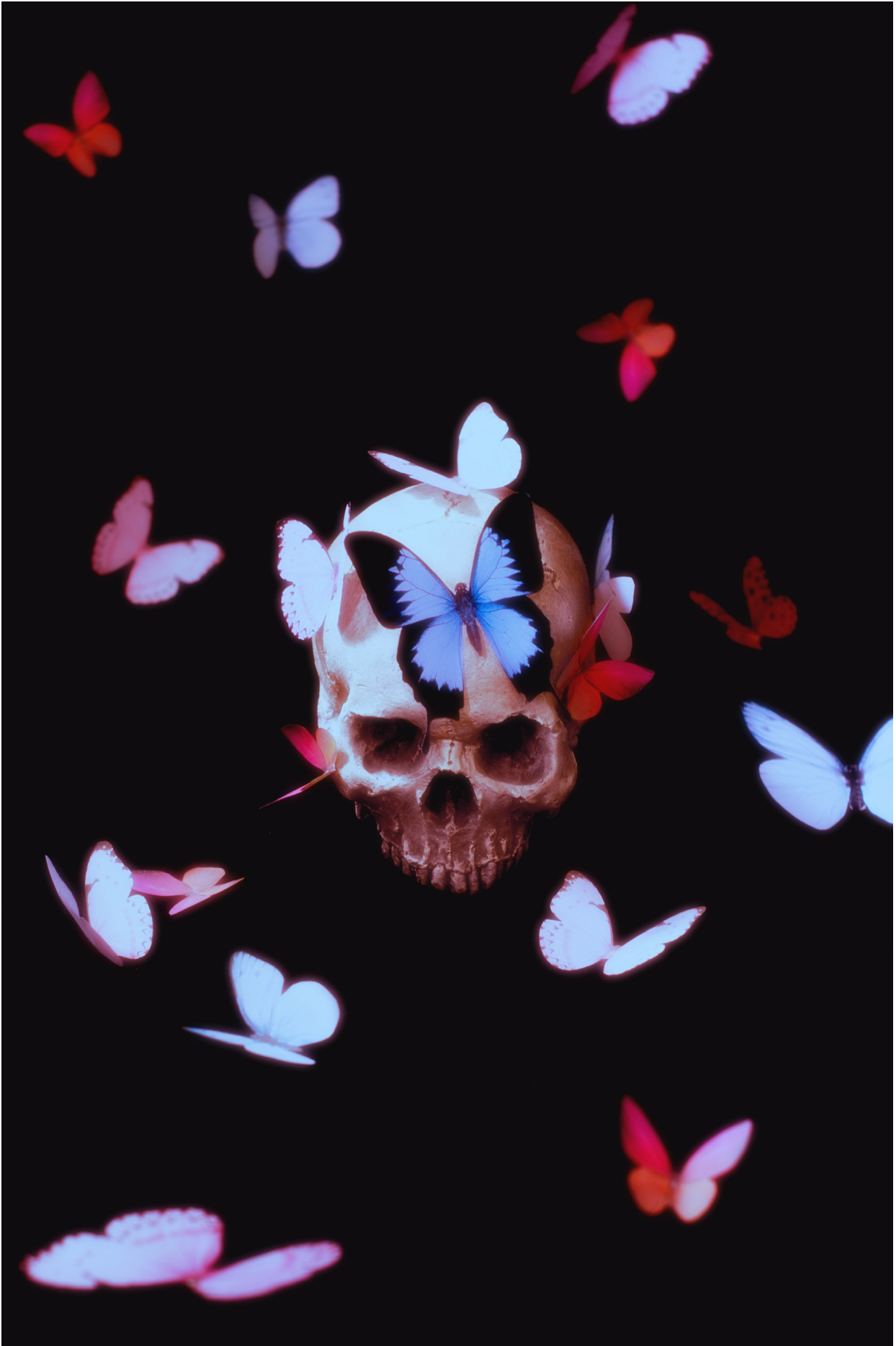
JACQUEMIN Danaé - TALM