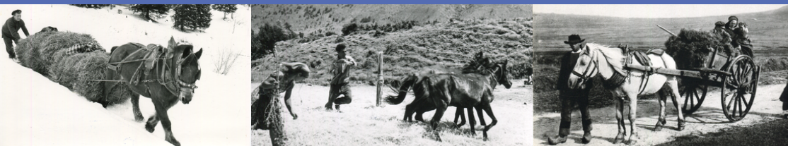
Credits Images : Photo de Gérard Collomb (1) - Musée du Quai Branly (2) - Carte postale en accès libre (3) - Impression service reprographie UA

Porté par le groupe du même nom, ce colloque est organisé, dans le cadre d'un partenariat entre l' ESTHUA, Institut national du tourisme - INNTO France de l' Université d'Angers , et le ministère de la culture , tous les deux ans dans une ville du cheval , autour de thématiques variées, avec le soutien de IIFCE et de la FFE . Son dessein est de permettre aux différentes cultures équines de se connaître davantage, lors d'une journée d'échanges et de partages . L'édition 2026 est consacrée au thème Races équines, histoires et territoires . Nous ferons jouer ces notions à partir de cas particuliers et sous des angles divers. Nous traiterons des races de chevaux dans leurs berceaux historiques. Les territoires seront ensuite considérés sous l'angle de la contribution des races, patrimonialisées, à la vie économique, sociale et culturelle. Seront enfin discutées les questions du travail avec les équidés, dans les représentations et les pratiques, hier et aujourd'hui. Notre objectif est de rassembler universitaires, institutionnels, professionnels de la filière, mais aussi passionnés des chevaux et du monde équin. Le colloque se terminera par une visite de la Jumenterie.