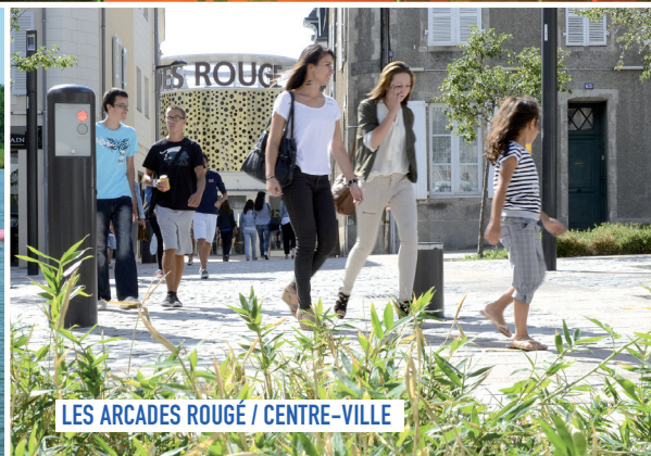
LES ARCADES ROUGE / CENTRE-VILLE