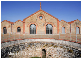
Musée du textile et de la mode