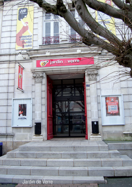
Jardin de Verre