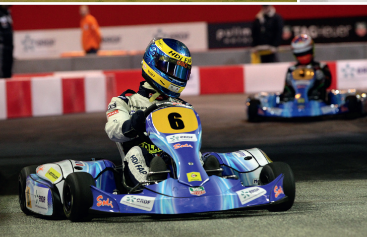
L'AUTRE USINE 10 activités sur un seul lieu : karting, bowling, lasergame, foot5, ...