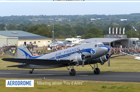
AERODROME Meeting aérien "Fou d'Ailes"