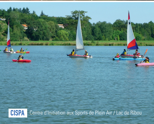
CISPA Centre d'Initiation aux Sports de Plein Air / Lac de Ribou