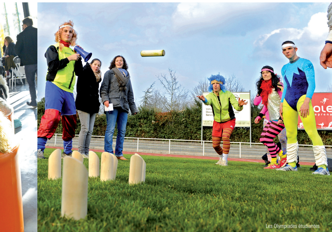
Les Olympiades étudiantes