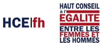
Danielle Bousquet, Présidente