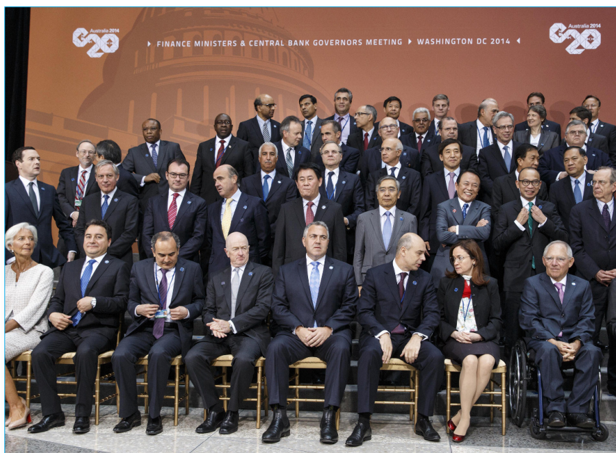
Rencontre des ministres des Finances et gouverneur.e.s de la Banque Centrale, Washington 2014