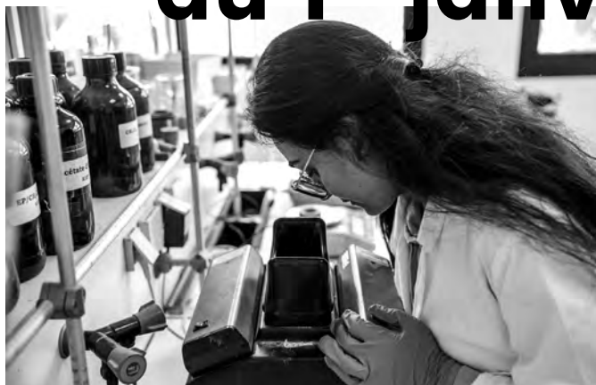
La recherche à l'UA s'appuie sur un millier de chercheurs.

Le nouveau contrat quinquennal (2022-2027) apporte son lot de changements pour les laboratoires de l'Université d'Angers et ses 26 équipes de recherche. Petit tour d'horizon des nouveautés.