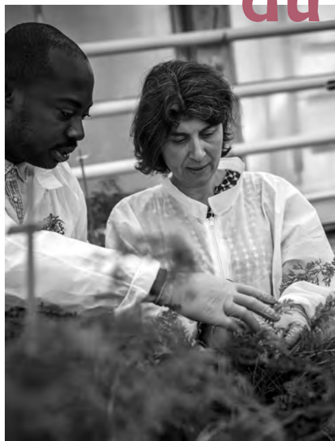
L'IRHS regroupe 260 spécialistes des végétaux.