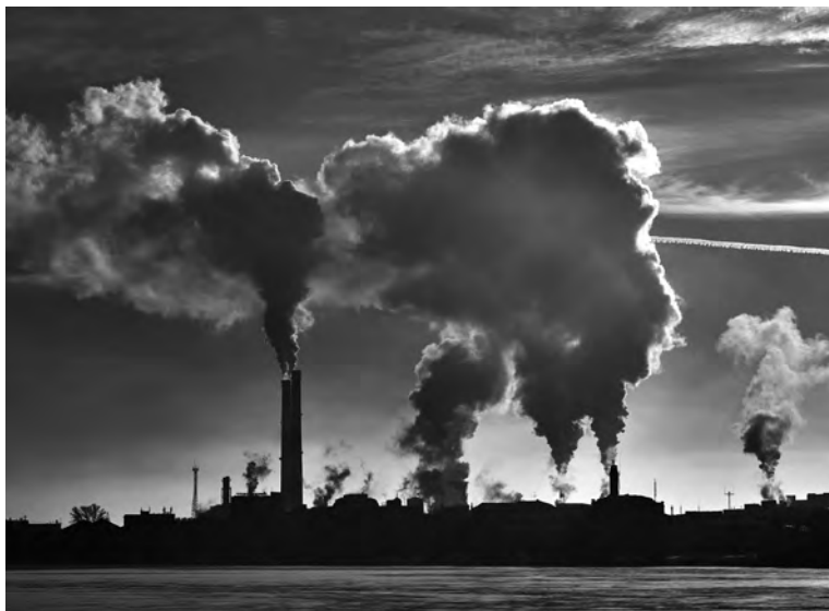
Le programme Valesor évaluera l'impact économique des pollutions.

Quel est le bénéfice pour les pouvoirs publics de restreindre l'usage de tel ou tel produit chimique ? Cette question est au centre de l'ambitieux programme de recherche européen Valesor, coordonné par l'Université d'Angers.